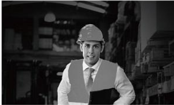
Smart IR On

CRENCIALIZACION RELOJES CHECADORES CONTROL VEHICULAR