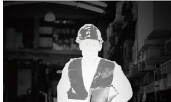
Smart IR Off